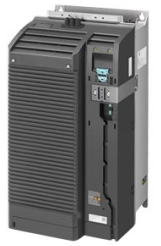
Иллюстрация аналогичная Figure similar

Номер артикула : 6SL3210-1PE28-8UL0 Article No. :